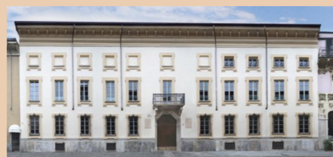
La sede centrale di Lodi