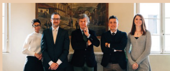
Gli Avvocati dello Studio Legale Rebecchi & Barbieri